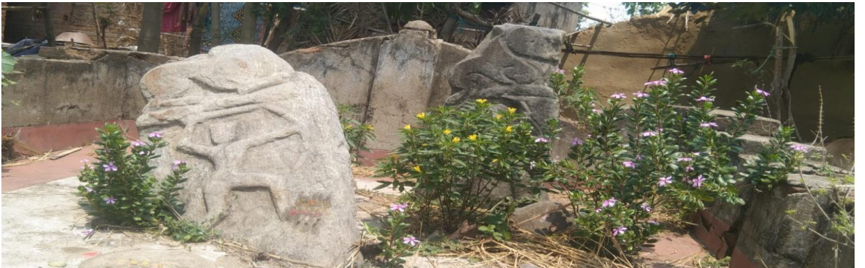
ভাসুর বোয়াসিন পাথর

ছাতনা অঞ্চলে প্রাপ্ত কয়েকটি বীরস্তুম্ব এখনকার প্রাচীন ইতিহাসের ঐতিহ্যকে ফুটিয়ে তুলতে সক্ষম। বীরস্তুম্ব হল বীর সেনার স্মৃতি চিহ্ন। কোনো যোদ্ধা যুদ্ধক্ষেত্রে প্রাণ হারালে তাঁর স্মৃতিরক্ষার্থে এরকম মূর্তি তৈরী করা হতো। এখানে অবস্থিত কামারকুলির একটি পুকুরে ছোটবড় কয়েকটি পাথরে সশস্ত্র যোদ্ধার মূর্তি খোদিত আছে। এছাড়াও ছাতনার পার্শ্ববর্তী ‘থুমপাথর’ নামক গ্রামের মাঠে দুটি পাথর আছে। তার একটিতে পুরুষের ও অন্যটিতে নারীর মূর্তি খোদাই আছে। কিছুদিন আগেও এখনকার মানুষেরা ঐ পাথর দুটিকে দেবতা জ্ঞানে পূজা করতেন। এই পাথরদুটি ‘ভাসুর বোয়াসিন’ নামে পরিচিত।